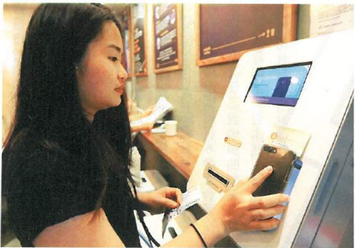
■台灣已有業者提供比特幣「BTM」服務，只要掃個人錢包的二維條碼，插入現鈔，就能完成交易。

往前推一大步。此舉不但能做到錢包實名制，做到完全的追蹤控管。甚至，中國可以利用世界工廠的地位，藉由全新的虛擬貨幣，撼動美元地位。