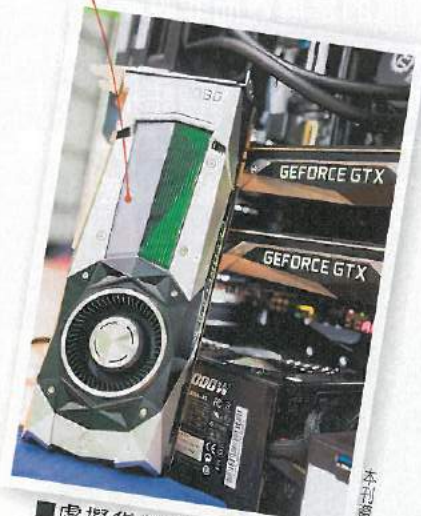
虛擬貨幣夯，帶動超微、輝達等公司生產的挖礦用晶片與顯示卡賣到斷貨。