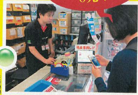
秋葉原首家收比特幣的3C店

買記憶卡2小時後，因比特幣價格上漲，剩下的錢跟消費前差不多，等於免費獲得記憶卡！不過，因為金額不到新台幣500元，等待交易成立確認時間長達35分鐘，是本週實測中最NG的地方。