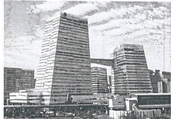
●中國信託南港總行。圖/本報資料照片

2012年起，中國信託即已納入影響力投資(impact investing)原則，投資決策過程除考慮財務報酬，亦兼顧非財務性的環境與社會正面影響性，並在金融營運中關注生態保護及污染議題，進行綠色相關