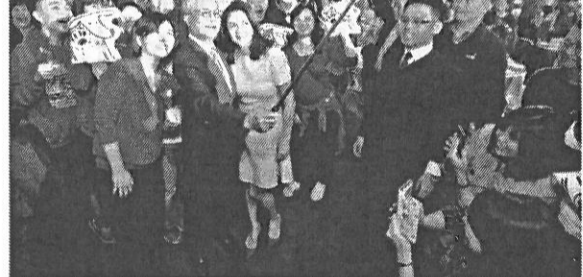
●台新金控「旺年會」，董事長吳東亮及夫人彭雪芬（圖中）與夾道歡迎的員工大玩自拍，整場氣氛High到最高點。圖/台新金提供

新的一年，以「喜迎新禧年，讓我們共同攜手，以穩健的步伐繼續向前」和員工共勉。旺年會在8千多位員工歡笑聲中，圓滿畫下句點。