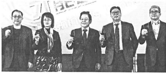
●國票金13日舉行尾牙，今年尾牙主題是「心不设限，才能超越極限」。

國票金加日本樂天銀行團隊的股東結構已確定，分別為49%、50%，日本樂天信用卡公司持股1%，加入結盟，魏啟林表示，除非未來