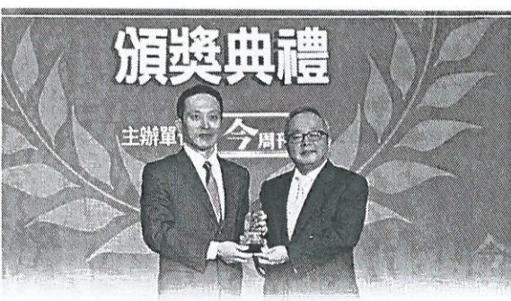
●凱基證券獲最佳財富管理大獎，受客戶及市場高度肯定。

凱基證券發展財富管理業務，堅持以客戶需求為導向，建置專業理財服務團隊，除招募高素質人才，並進行完整專業理財知識教育訓練，結合全控及專家團隊資源，服務更加全面。