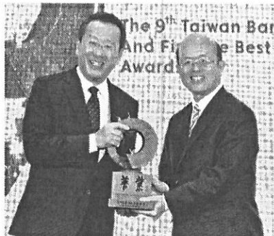
●臺灣企銀獲商業獎「最佳企業金融獎」及「最佳中小企業金融獎」兩大「特優」獎項，金管會主委顧立雄（左）頒發「最佳企業金融獎」獎座給臺灣企銀董事長黃博怡（右）。

界奧斯卡之稱的商業獎，兩項大獎「最佳企業金融獎」、「最佳中小企業金融獎」的特優獎，未來臺灣企銀秉持著「傾聽企業的聲音，回應這塊土地的需要」，提供企業成長所需資金。