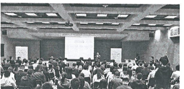
●總部徵才說明會是富邦金控每年徵才的畫龍點睛，今年預計將在3月23日舉行。

富邦金控總經理韓蔚廷表示，富邦金控每股稅後盈餘連續十年榮登國內金控第一，創造了傲視同儕的亮眼績效，在兩岸三地擁有最完整的金融平台，並持續以打造幸福企業為重要目標。2018年已連續兩年入選美國道瓊永續世界指數成分股(Dow Jones Sustainability Index)，並持續在「人才發展與培育」項目排名領先；2018年並首度入選財星全球500大企業，是有志投入金融業的首選企業。